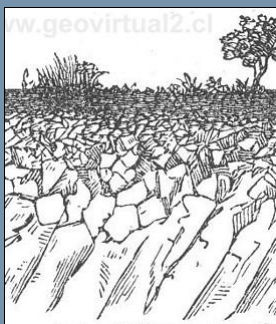
Polack 1892: Formación de suelos. Aquí

La meteorización: Suelos / Podsol / Tschernoziem