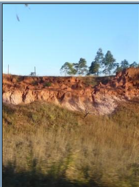
Meteorización laterítica - suelos lateríticos en Brasil.

La pedología es un ciencia interdisciplinaria - es decir se necesita conocimientos profundos en: Biología Botánica Microbiología Química Química orgánica Mineralogía Geología Hidrología